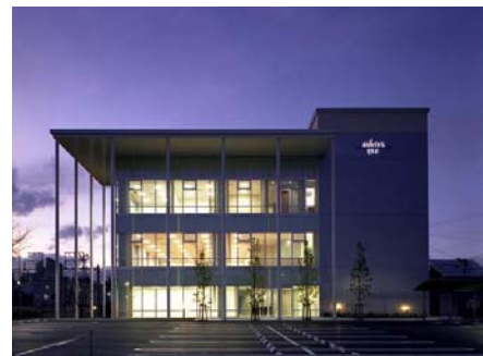
塩尻インキュベーションプラザ 外観

塩尻インキュベーションプラザ(通称SIP)とは、昨今人材不足とされている組込み技術者の育成と人材排出、起業支援を目的とした、「 塩尻市組込みシステム産業振興プロジェクト 」を産学官連携し、活動・推進しているインキュベーション施設です。